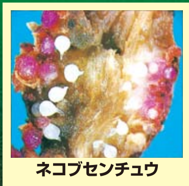
ネコブセンチュウ