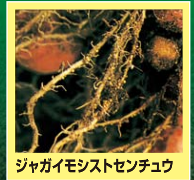
ジャガイモシストセンチュウ